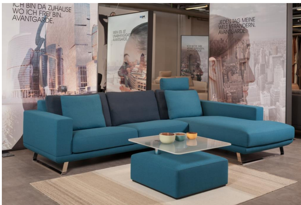
Das Systemprogramm AV 600: Hier mit Longchair mit hohen Armlehnen in hochwertigem Wollstoff.

Weiteres druckfähiges Bildmaterial steht zur Verfügung. Bitte fordern Sie dies bei uns an oder laden Sie sich das gewünschte Bildmaterial auf unserer Mediadatenbank unter www.media.erpo.de herunter.