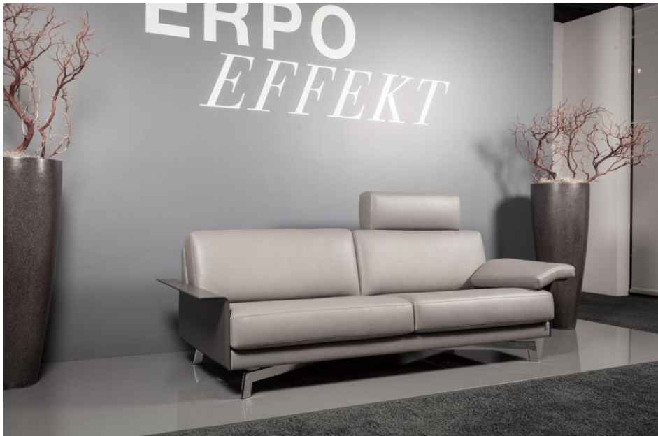
AV 500: Neues Armlehn-Design mit extrem schmaler Linienführung aus Kernleder.